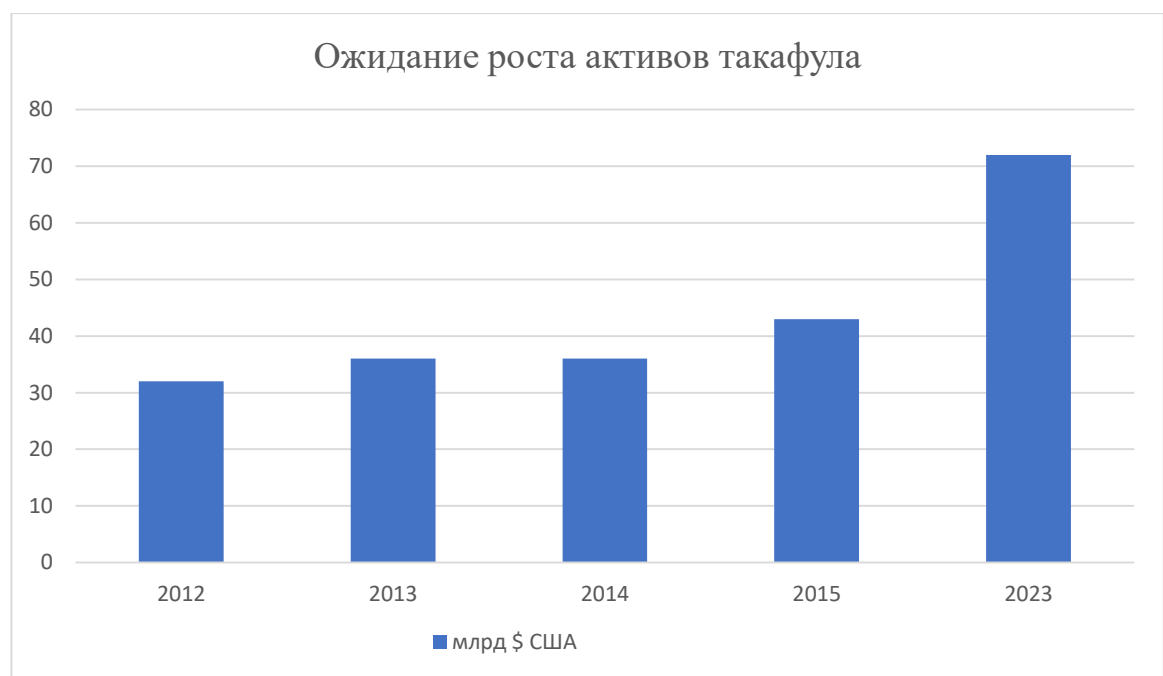
Рисунок 2. «Ожидание роста активов такафула».4

Рынок такафул-страхования сегментируется по каналам сбыта, типам, и регионам. По каналам распространения он подразделяется на агентов и брокеров, банки другие (рис.2).